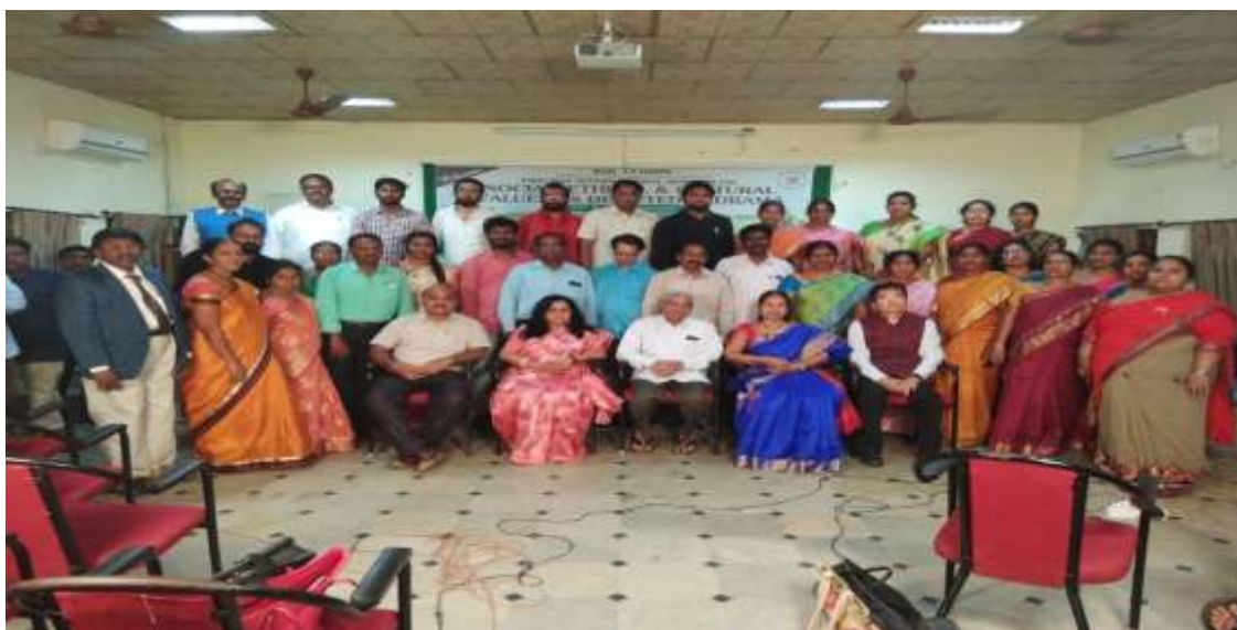
Participants' group photo