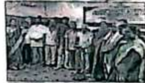
పదమూడు ప్రాచీనామృత్య దృశ్యం

సమస్యలు: ఉపాధ్యాయులకు కష్టాల్గుట వరితము నన్ను నమ్మకము ఉదాహరింప వలయును. ని. వివేకాక్ష మూర్తియందు వర్తమాన్యుల ని. శివమూర్తి అన్నాదు. 'మైన్ కళాశాలలో' పాఠశాలని, నెల టియాలజ్ నివహించు, పాఠశాలని వెంయ్యకాదు దూసి 2.1 నియోగ్ 7 రోజులపాటు ప్యాన్జీ వెంయ్య మేరెంద్ శిక్షణ కార్యక్రమాన్ని నిర్వహించు. డి. శివమూర్తి భాగనా దూయగ్ రోజు క్షేత్ర చారం వెంయ్యమార్ ఘట్ట అతికిగా పాల్గొని ఉపాధ్యాయులకు, వరితముల అవ్ అంకంప మార్గకాదు. క్షేత్రమార్ అవ్ అంకంప కష్టాల్గుట దూయగ్ జరుగుతుందని చెప్పాడు. కార్యక్ర మంలో కూగా ఉన్నపాకర్ దూయగ్ 2. వెంయ్య క్షేత్రంప పాల్గొన్నాడు.