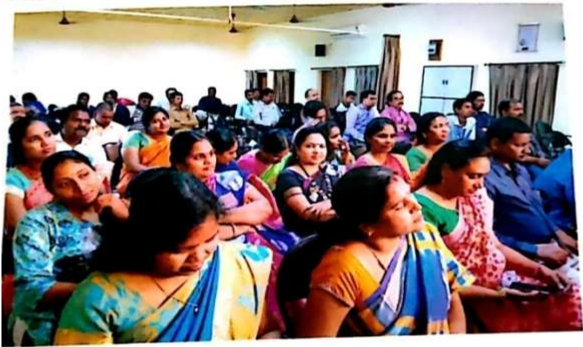
Faculty and Research Scholars attended the Seminar