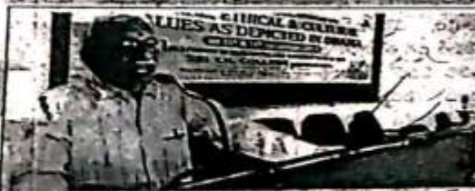
మదన్మూర్తి మార్గదర్శకుడు ప్రొ. ఫివర్ విక్రవాధరాలి

4. శనివారం, 14 డిసెంబర్ 2019 సోమ గోదావరి