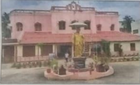
నరసాపురంలో వైఎస్ కళాశాల పరిపాలన భవనం

నరసాపురం: రాష్ట్రంలోనే గుర్తింపు కలిగిన నరసాపురం వైఎస్ కళాశాల స్థాయి పెరిగింది. మెంటారు కళాశాలగా యూనివర్సిటీ గ్రాంట్స్ కమిషన్ (యూజీసీ) దీనిని గుర్తించింది. యూజీసీ దేశంలో ప్రతిష్టాత్మకంగా ఆమలు చేయడానికి రూపొందించిన పరామర్శ పథకానికి వైఎస్ కళాశాలను ఎంపిక చేసింది. దేశంలో