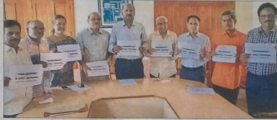
విలేకరుల సమావేశంలో పరామర్శ పోస్టర్ను విడుదల చేస్తున్న యాజమాన్యం

నరసాపురం: రాష్ట్రంలోనే గుర్తింపు కలిగిన నరసాపురం వైఎస్ కళాశాల స్థాయి పెరిగింది. మెంటారు కళాశాలగా యూనివర్సిటీ గ్రాంట్స్ కమిషన్ (యూజీసీ) దీనిని గుర్తించింది. యూజీసీ దేశంలో ప్రతిష్టాత్మకంగా ఆమలు చేయడానికి రూపొందించిన పరామర్శ పథకానికి వైఎస్ కళాశాలను ఎంపిక చేసింది. దేశంలో