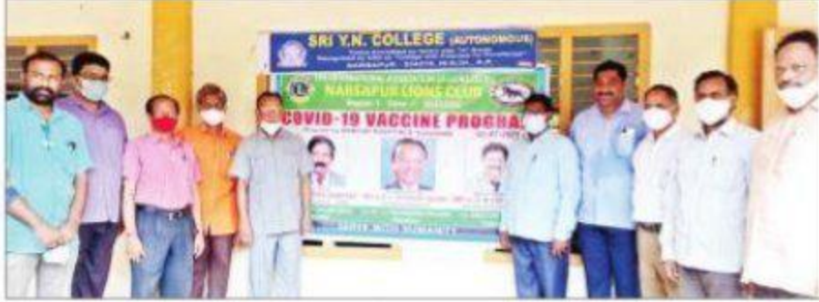
కార్యక్రమంలో పాల్గొన్న డాక్టర్ చినిమిల్లి