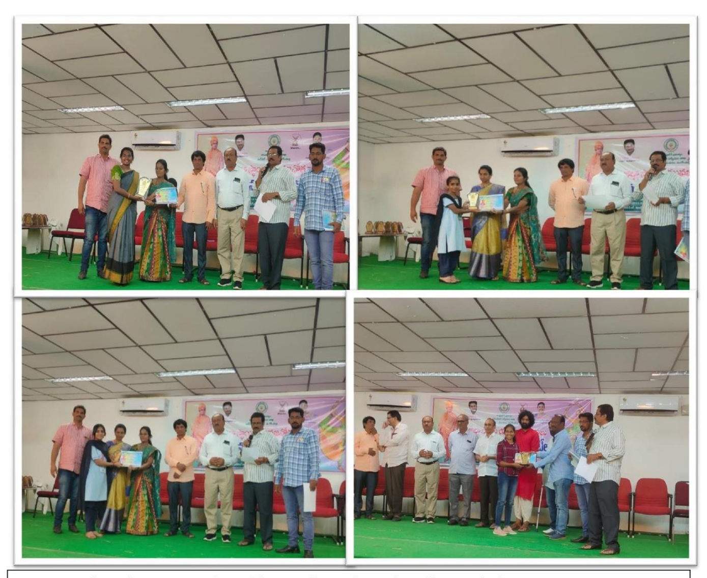
YuvJnothsavalu 2022 Conducted by Youth Services of Andhra Pradesh Government at SRKR Engineering College on 18/11/22. Our students from Both MBA & BBA have participated in various participants and bagged various prizes.